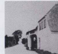
Østerlund Kro 1903 - 1905