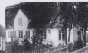
Mosevang 1921 - 1925