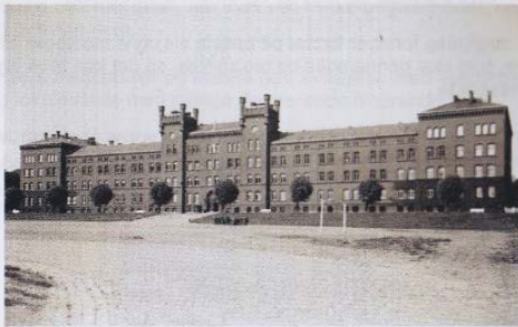
Haderslev Kaserne 1914 - 18