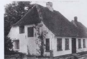
Løjteroft 8 1910 - 1921