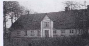
Tvendalsgaard 1897 - 1902